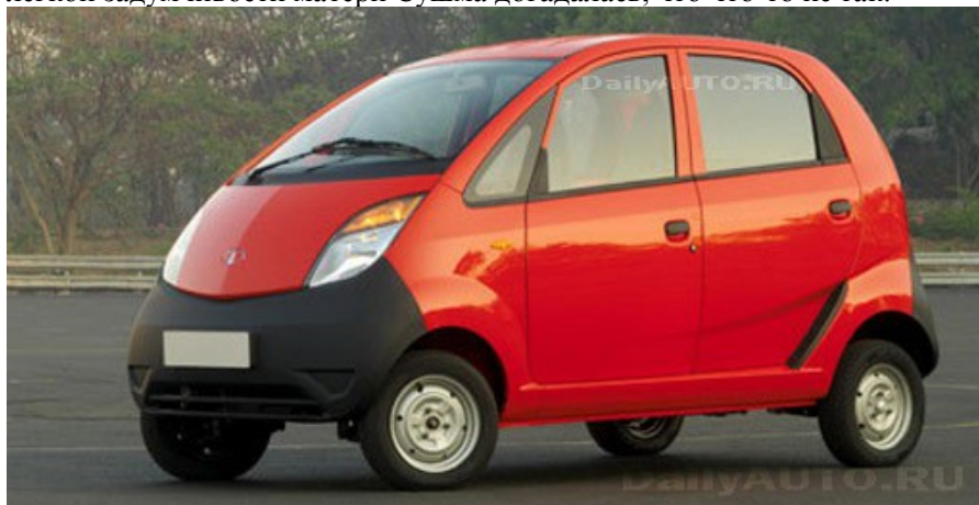
"Народный автомобиль" Nano

Раджан отрицательно покачал головой, и как раз в это время с улицы послышался звук остановившейся машины, по которому они поняли, что вернулись с базара отец, мать и Ниша. По лицу отца и по легкой задумчивости матери Сушма догадалась, что что-то не так.