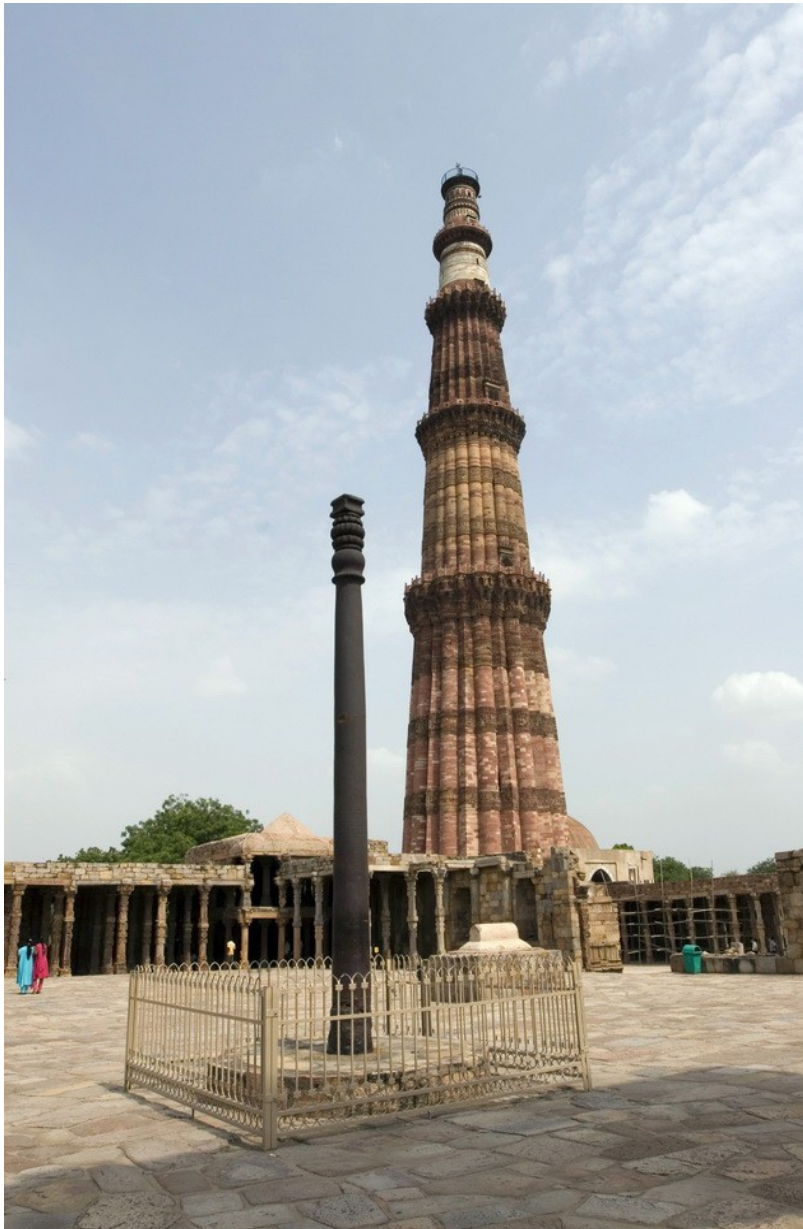
Кутуб-минар и железная колонна, Дели.